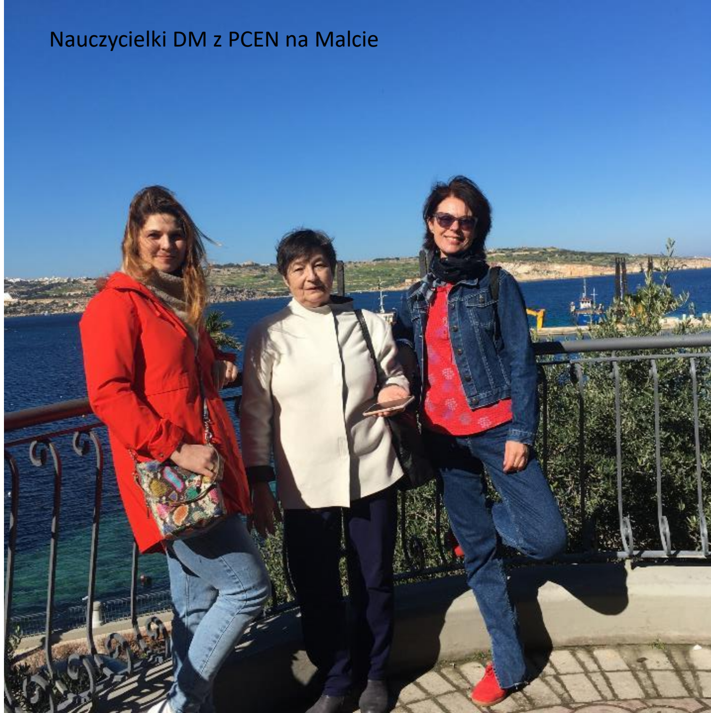
Nauczycielki DM z PCEN na Malcie