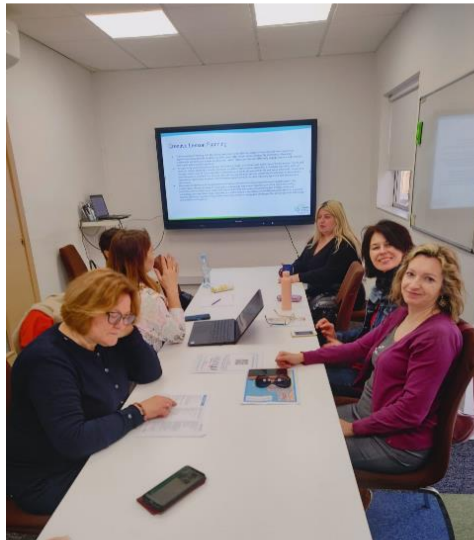
Pracowite poranki w Alpha School